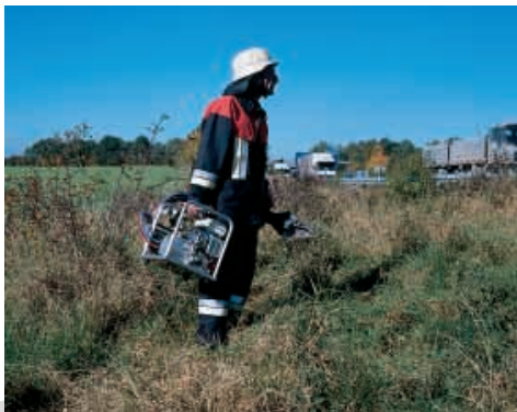
Rettungsgeräte transportieren früher und heute – durch CP 100 mit freien Händen sicher unterwegs