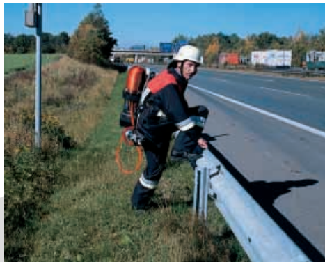
Carrying of rescue tools, old and new method – with CP 100 your hands are free